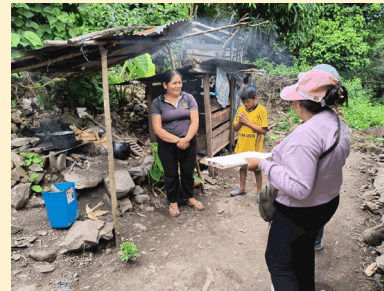
Die Küche im Haus eines bewerbenden Schülers